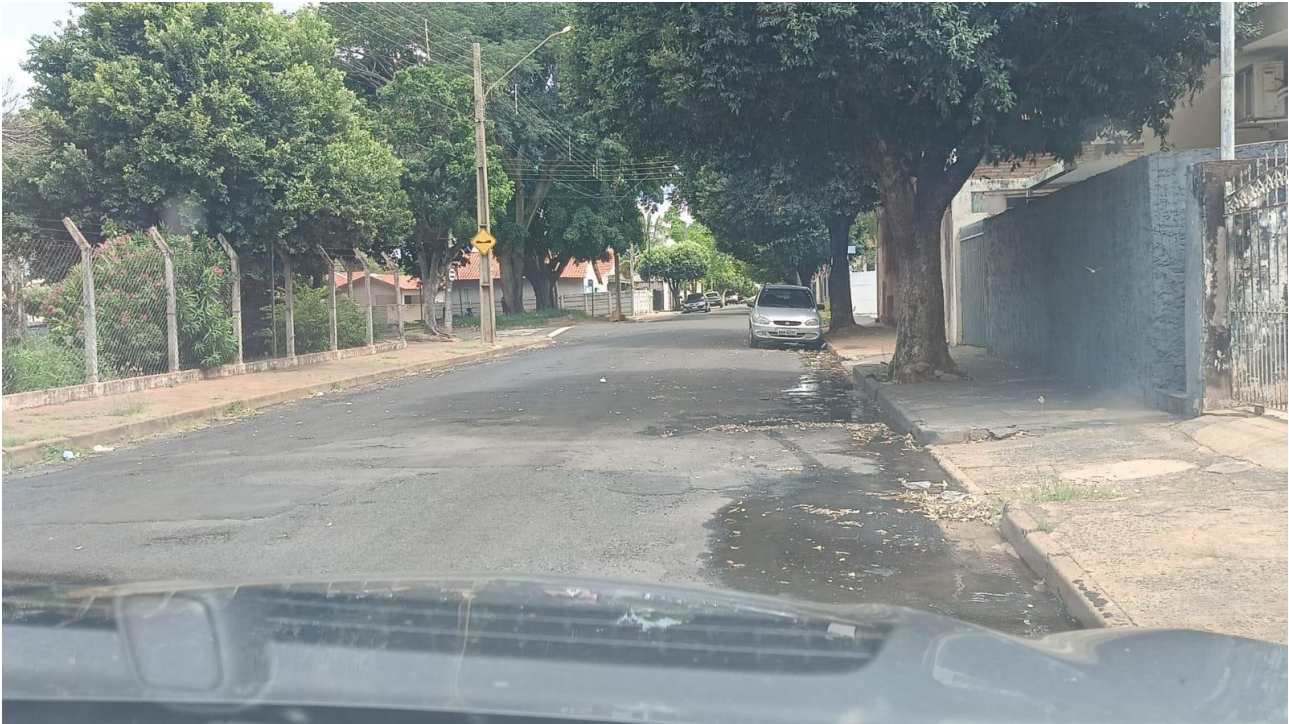
Rua Barão do Rio Branco

Documento assinado digitalmente nos termos da Resolução nº 01, de 02 de fevereiro de 2021, da Câmara Municipal de Votuporanga, conforme impressão à margem direita.