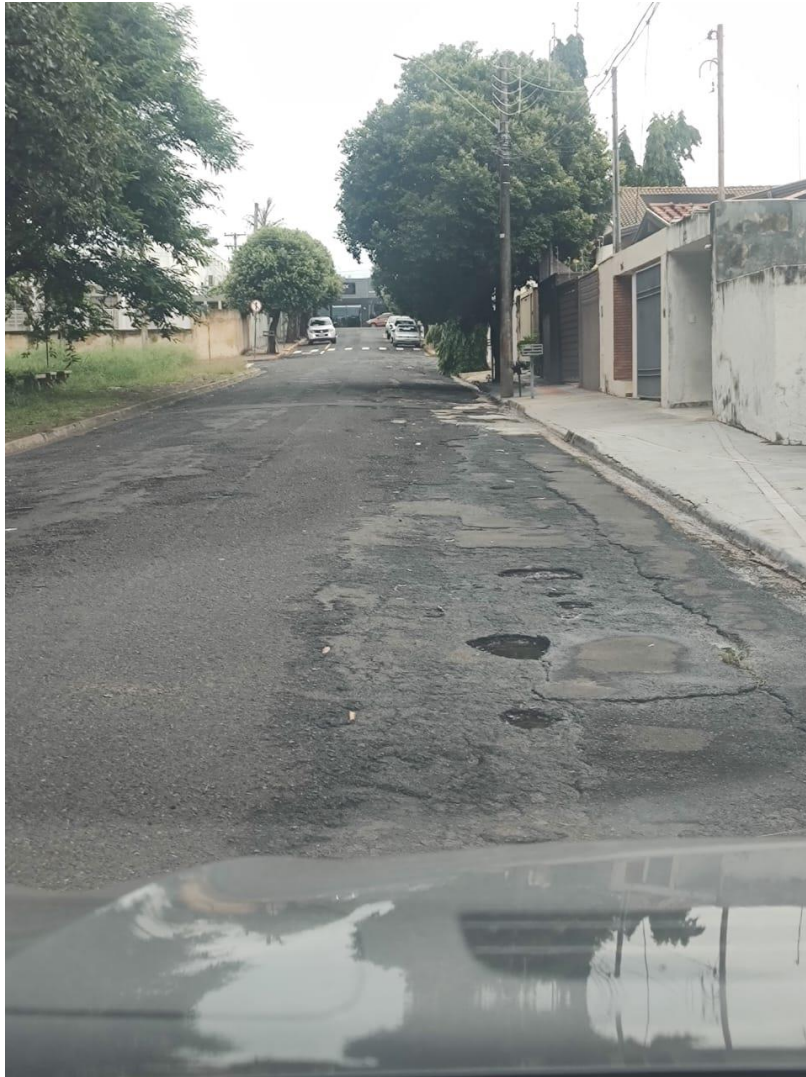
Rua Vila Rica