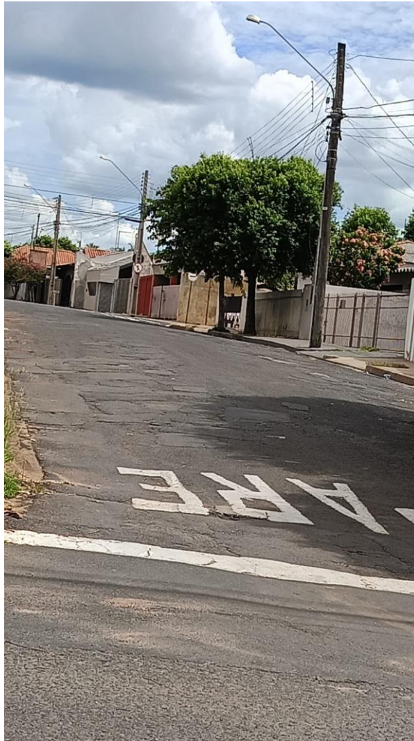
Rua Denizart Vidigal

Documento assinado digitalmente nos termos da Resolução nº 01, de 02 de fevereiro de 2021, da Câmara Municipal de Votuporanga, conforme impressão à margem direita.