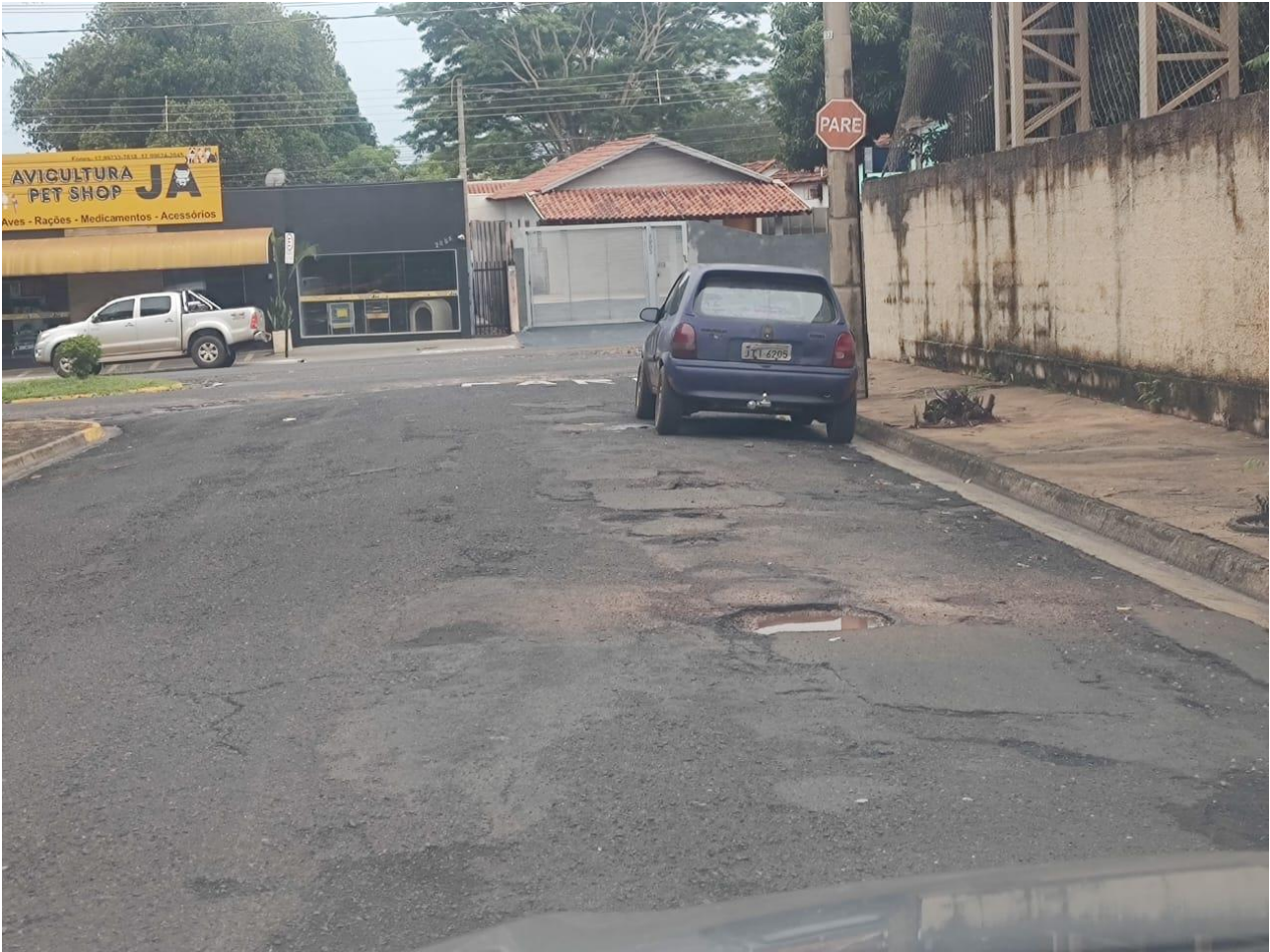
Rua Oito de Agosto

Documento assinado digitalmente nos termos da Resolução nº 01, de 02 de fevereiro de 2021, da Câmara Municipal de Votuporanga, conforme impressão à margem direita.