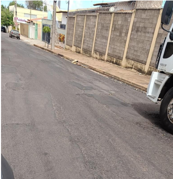
Rua Ponta Porã