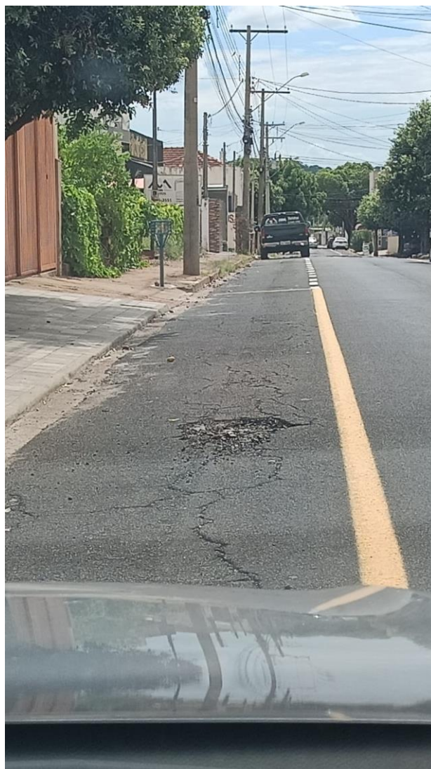
Rua Padre Izidoro Cordeiro Paranhos

Documento assinado digitalmente nos termos da Resolução nº 01, de 02 de fevereiro de 2021, da Câmara Municipal de Votuporanga, conforme impressão à margem direita.