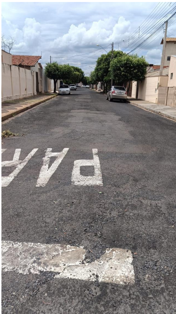
Rua Ana Costa Ramos

Documento assinado digitalmente nos termos da Resolução nº 01, de 02 de fevereiro de 2021, da Câmara Municipal de Votuporanga, conforme impressão à margem direita.