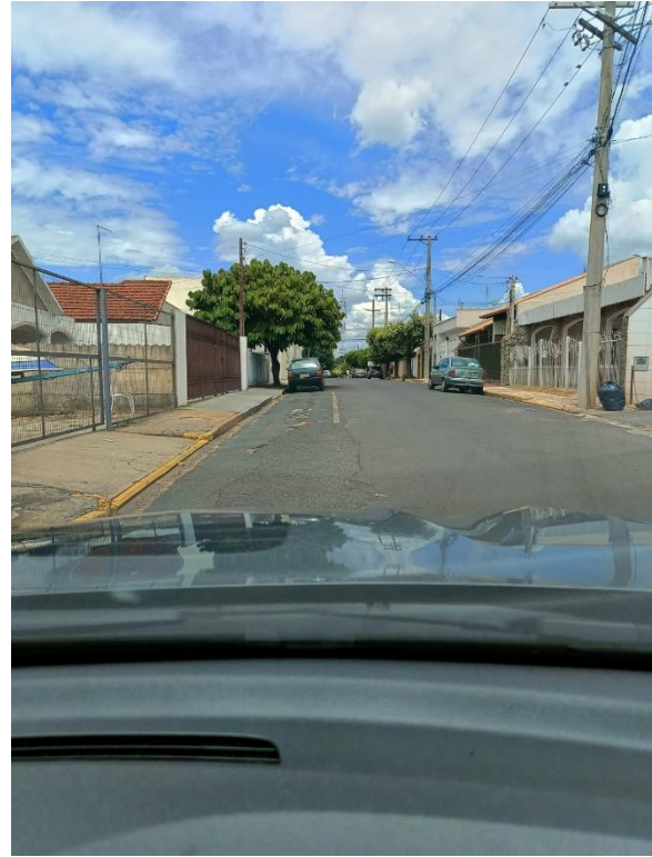
Rua Antônio Batista Pereira

Documento assinado digitalmente nos termos da Resolução nº 01, de 02 de fevereiro de 2021, da Câmara Municipal de Votuporanga, conforme impressão à margem direita.