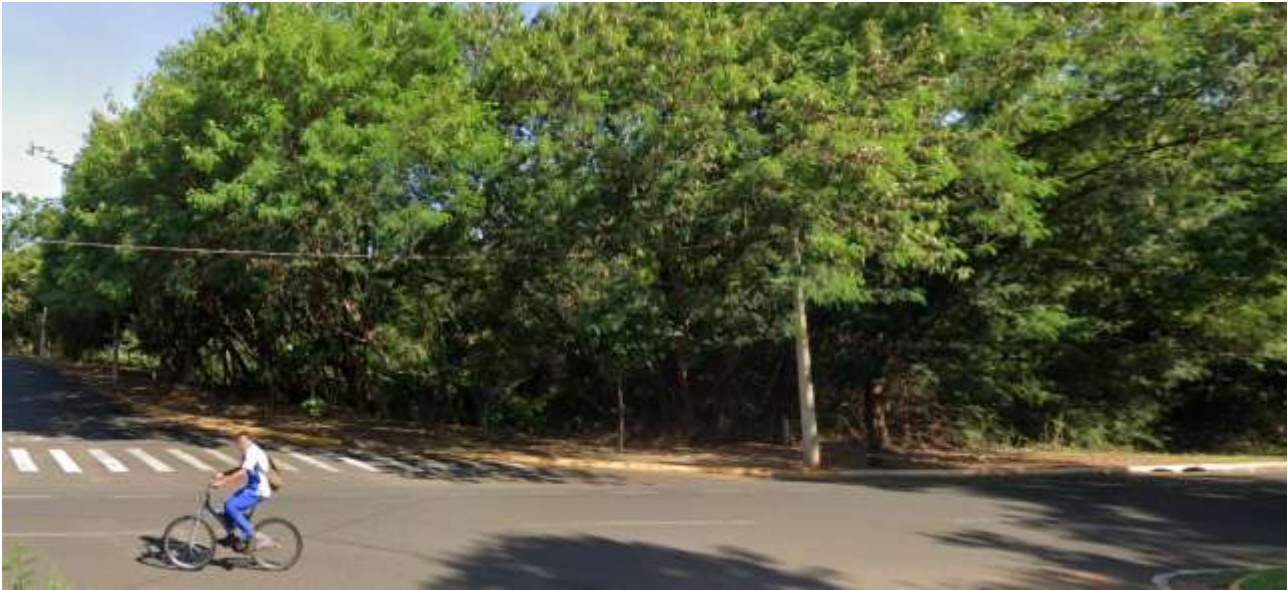
Reserva Ambiental Priscila de Souza que não tem a placa.

Documento assinado digitalmente nos termos da Resolução nº 01, de 02 de fevereiro de 2021, da Câmara Municipal de Votuporanga, conforme impressão à margem direita.