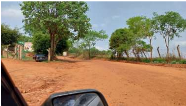
3. Bifurcação existente na Estrada Municipal Primo Furlani – VTG 371 à Estrada Municipal Mário Dorna – VTG 148 e sentido VTG 446