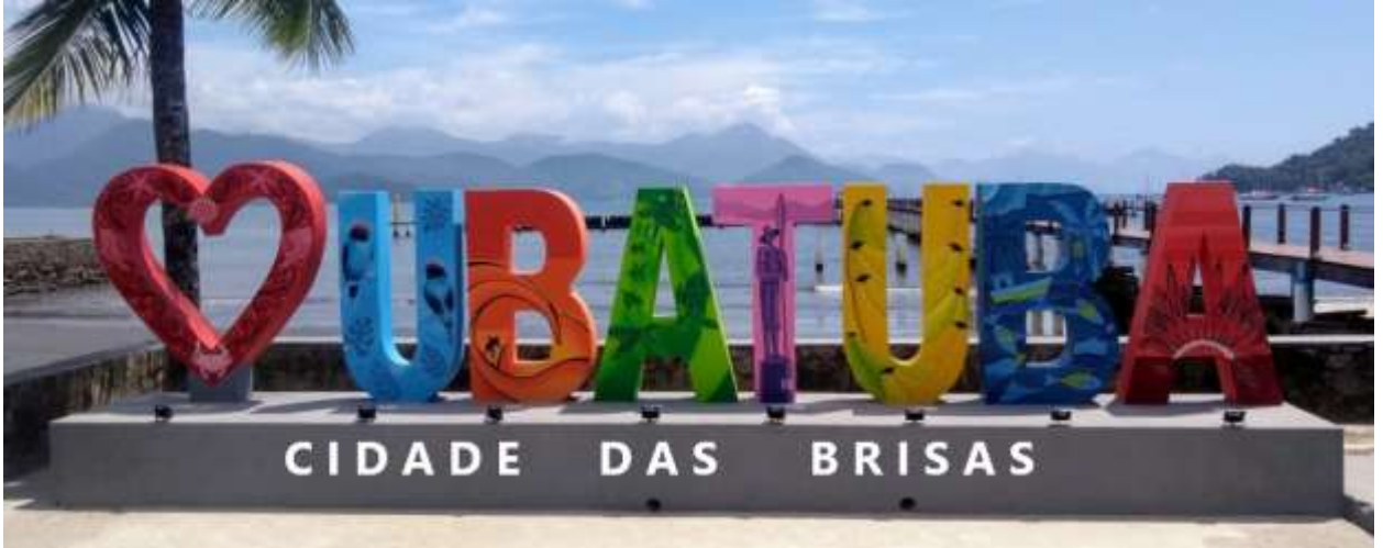
Sugestão de letreiro.

Documento assinado digitalmente nos termos da Resolução nº 01, de 02 de fevereiro de 2021, da Câmara Municipal de Votuporanga, conforme impressão à margem direita.