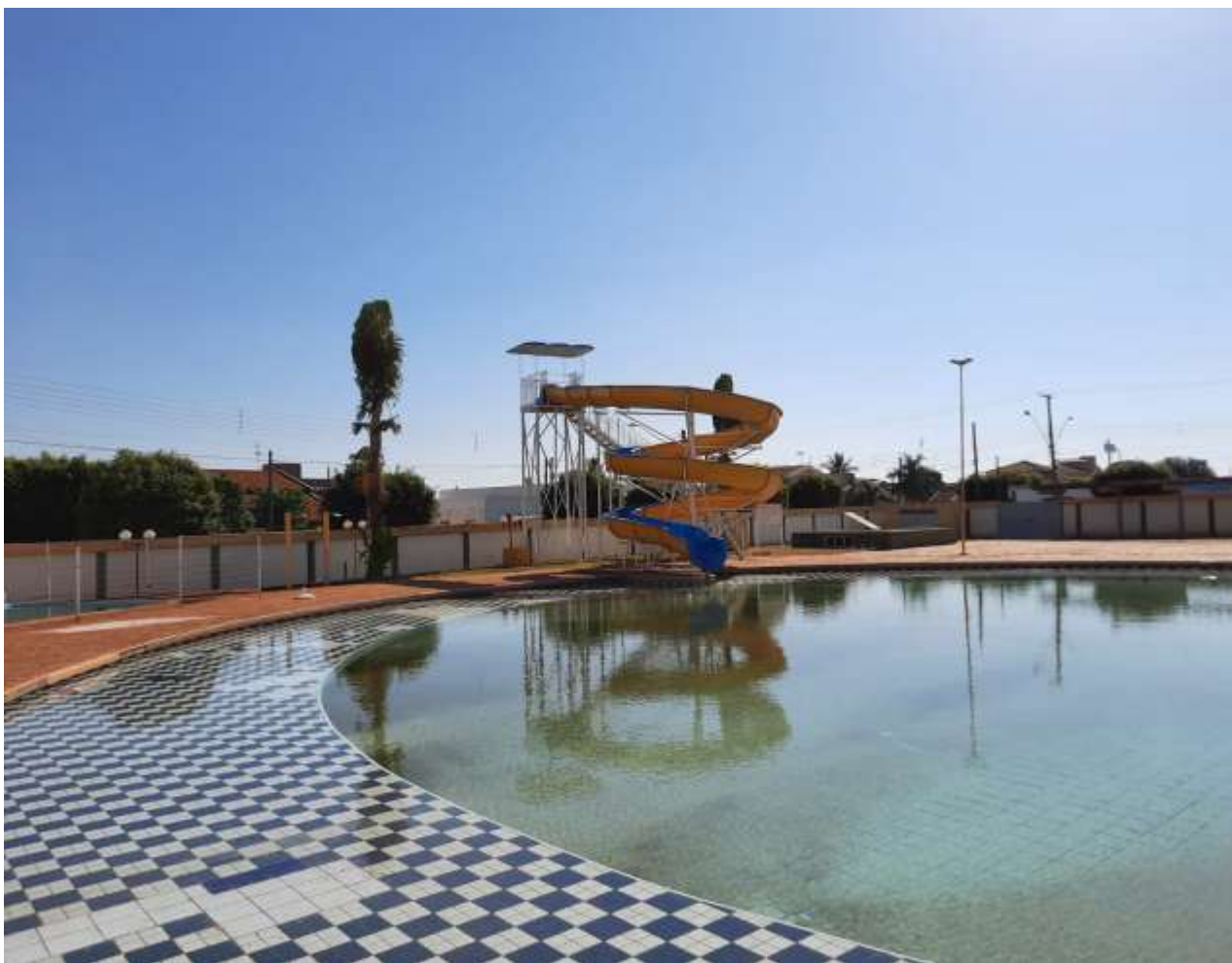
CIDADE DE OUROESTE - SP