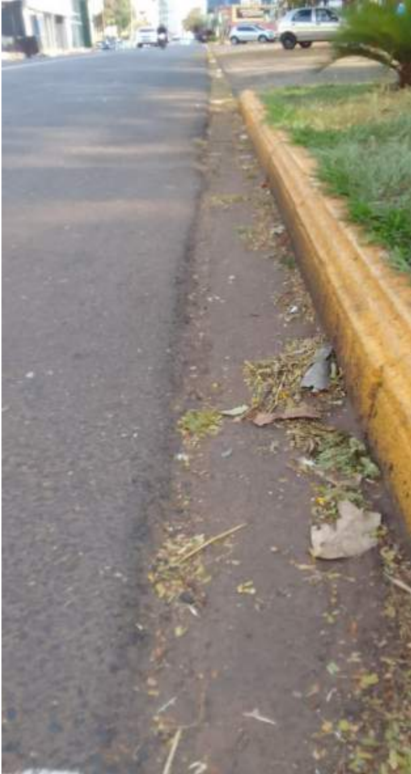
Rua Pernambuco esquina com a Rua Itacolomi