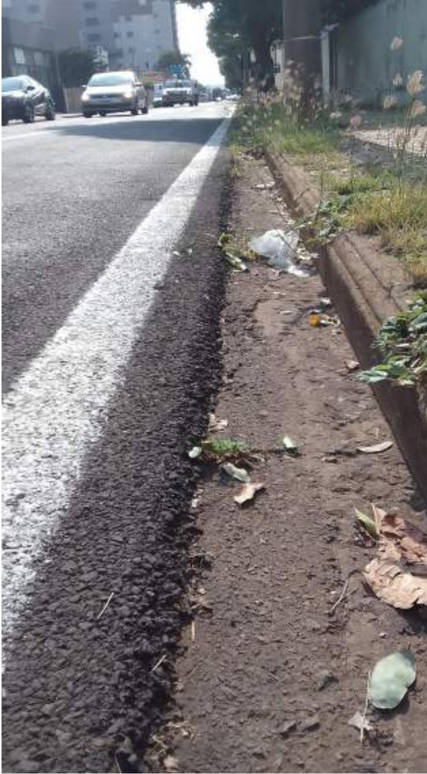
Rua Tibagi esquina com a Rua Iguassú

CÓPIA DE DOCUMENTO ASSINADO DIGITALMENTE EM 12/09/2023 ÀS 14:02:52 POR: [Nome do usuário] - [Cargo] - [Departamento]. Para mais informações, consulte o processo nº 4.509/2023. O sistema de segurança digital garante a autenticidade e a integridade do documento.