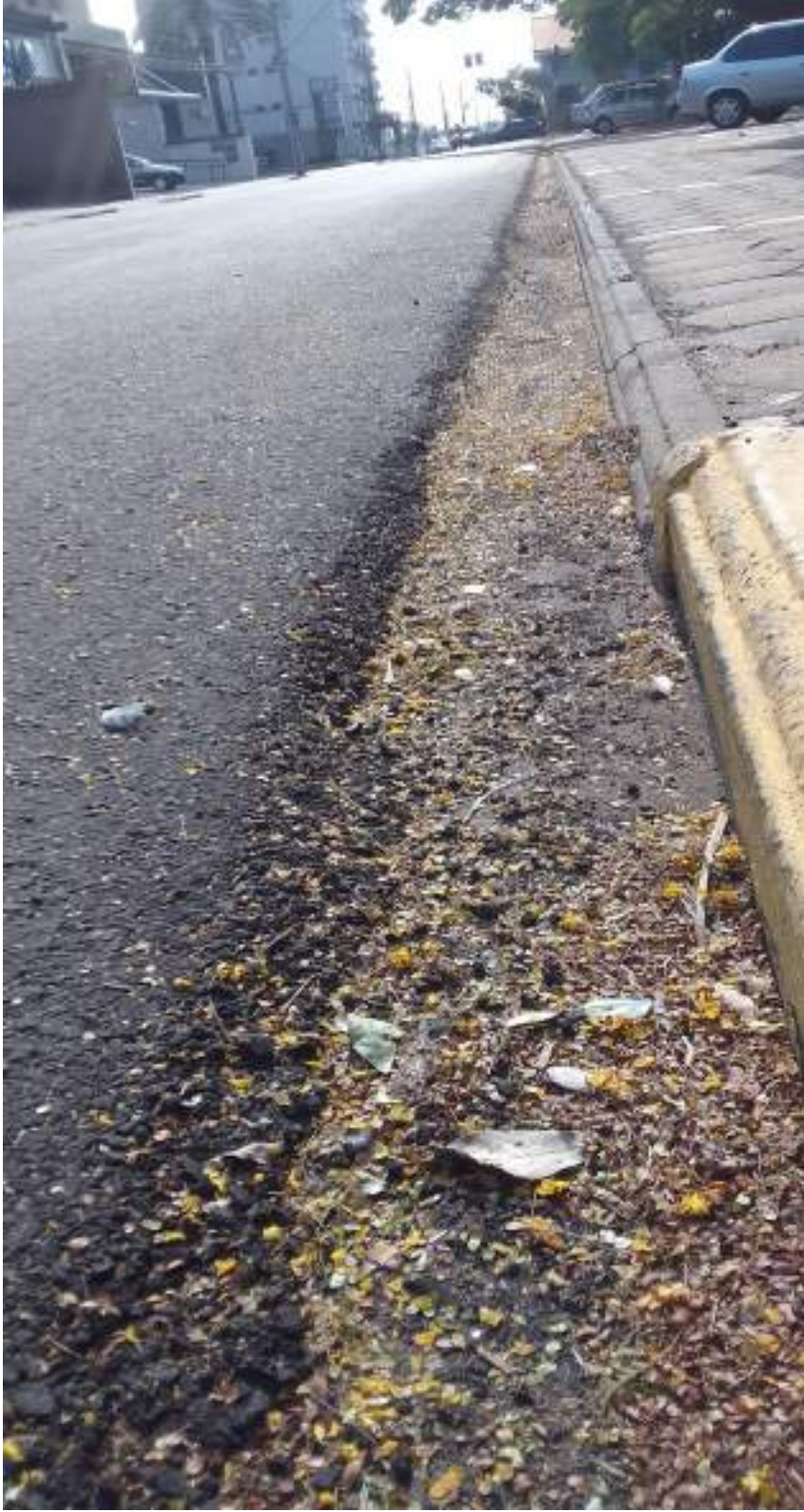
Rua Tocantins esquina com a Rua Pernambuco

CÓPIA DE DOCUMENTO ASSINADO DIGITALMENTE POR: [ID DO EMPREGADO] Nº de Matrícula: [Nº DE MATRÍCULA] em [DATA] às [HORA] em [LOCAL] por [NOME DO EMPREGADO] - [CARGO].