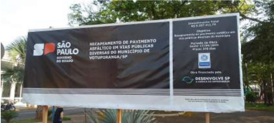
Placa das obras

CÓPIA DE DOCUMENTO ASSINADO DIGITALMENTE POR: [Assinatura] Nº: [Número] | PROCESSO DE TIRAGEM: [Número] | DATA: [Data] | LOCAL: [Local] | HORARIO: [Horario] | IDENTIFICADOR: [Identificador]