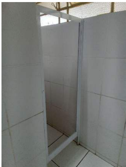
Porta faltante no banheiro feminino.

C.9) Foi observada a falta de papel higiênico nos banheiros inspecionados?