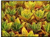
Cróton Amarelo - 30 unid. (Codiaeum variegatum)