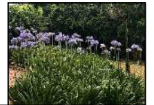
Agapanto - 70 unid. (Agapanthus africanus)