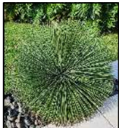
Agave Palito - 21 unid. (Agave geminiflora)