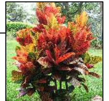
Cróton Vermelho - 21 unid. (Codiaeum variegatum)