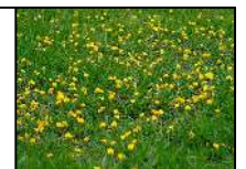
Grama Amendoim (Arachis repens)