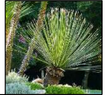
Dasyliion acrotrichum - 4 unid.