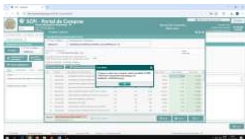
CAMARA VOTUP.png ~154 KB

Documento enviado para assinatura ao(s): NÃO HÁ OU NÃO O INFORMADO. Para verificar a(s) assinatura(s), utilize o seu validador preferencial. e-CAM | PROCESSO ELETRÔNICO | <<<<>>DOCUMENTO OFICIAL<<<>>> DATA / HORA: 20/10/2025 13:52:04 | CÂMARA MUNICIPAL DE VOTUPORANGA/SP. CHAVE DE ACESSO: PROTM-464308-5S6Z2K-2F7W3V | Para validar acesse nosso Portal em: http://www.camaravotuporanga.sp.gov.br .