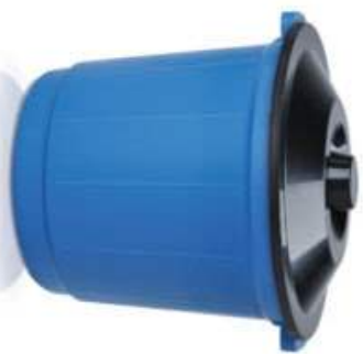
Linha Lixeiras LIXEIRA COM PEDAL DESMONTADA - 21 LITROS