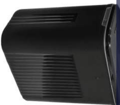
Lançamentos / Linha Lixeiras