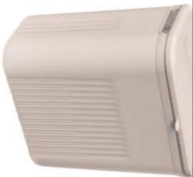
Lançamentos / Linha Lixeiras