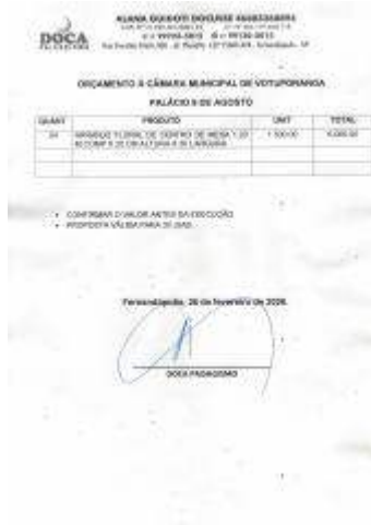
ORÇAMENTO CÂMARA.jpg ~761 KB