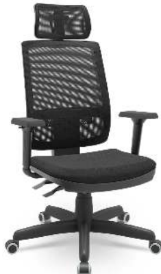
Cadeira de Escritório Presidente Brizza Ergonômica Braço Shift ...