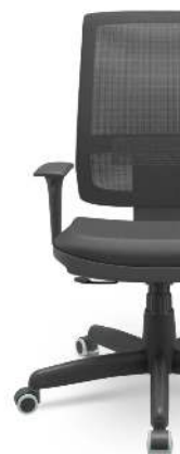
Cadeira Brizza Nr17 Assento Estofado C...