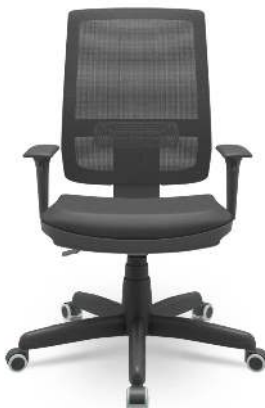
Cadeira Brizza Back System Braços Reguláveis Couro Sintétic...