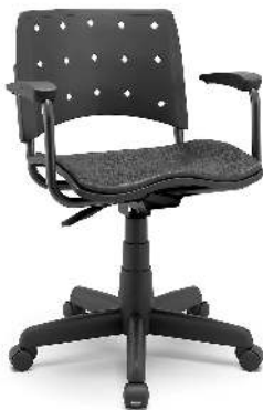
Cadeira Giratória Secretária Ergoplax Plaxmetal Cor Preto Co...