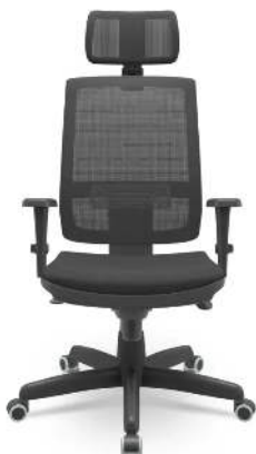
Cadeira de Escritório Presidente Brizza Autocompensador com...