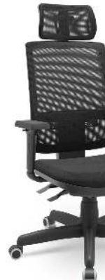
Cadeira de Escritório Brizza Ergonômica