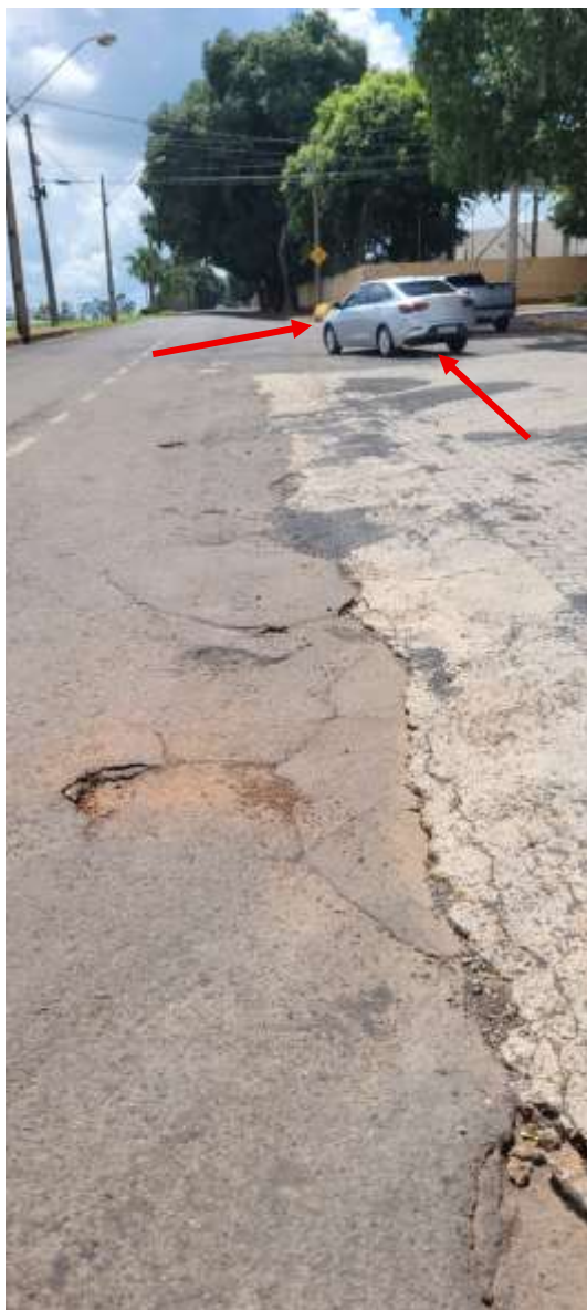
Conflito na saída de veículos

Documento assinado digitalmente nos termos da Resolução nº 01, de 02 de fevereiro de 2021, da Câmara Municipal de Votuporanga, conforme impressão à margem direita.