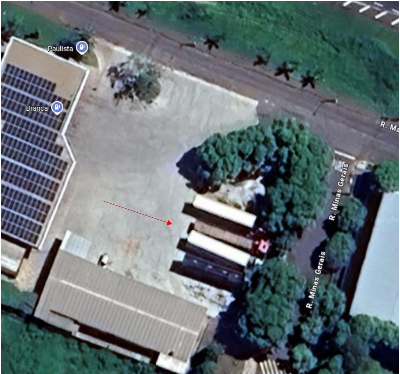
Estacionamento de veículos na área da Praça

Documento assinado digitalmente nos termos da Resolução nº 01, de 02 de fevereiro de 2021, da Câmara Municipal de Votuporanga, conforme impressão à margem direita.