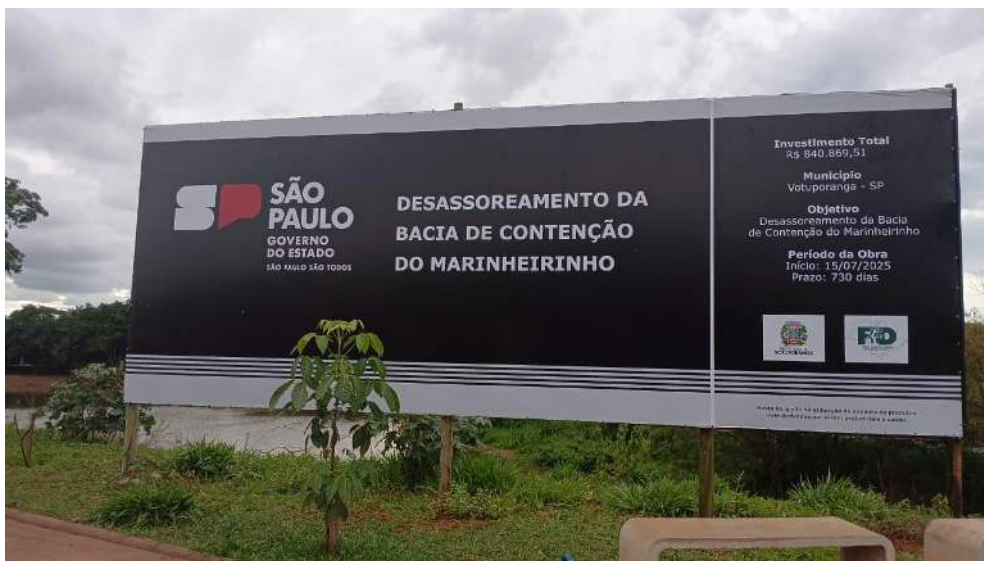
Figura 1 – Placa da Obra