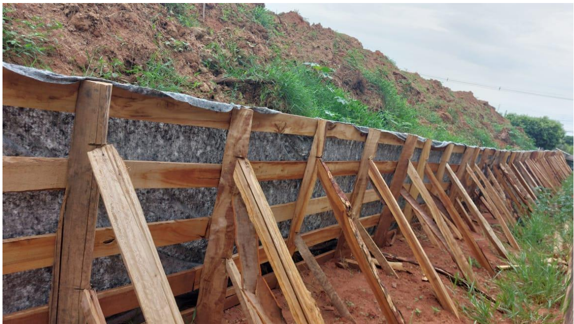
Figura 36 – Descarte da material da represa e finalização da paliçada