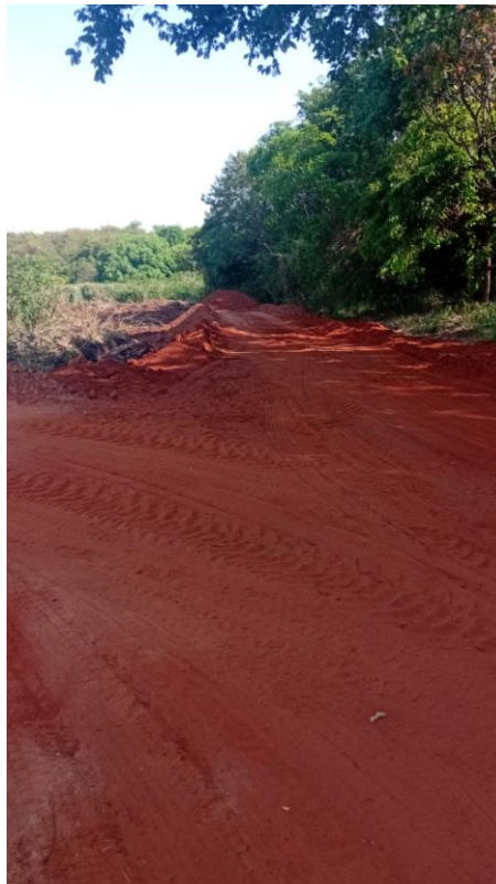
Figura 34 – Construção de caminhos para acesso a represa