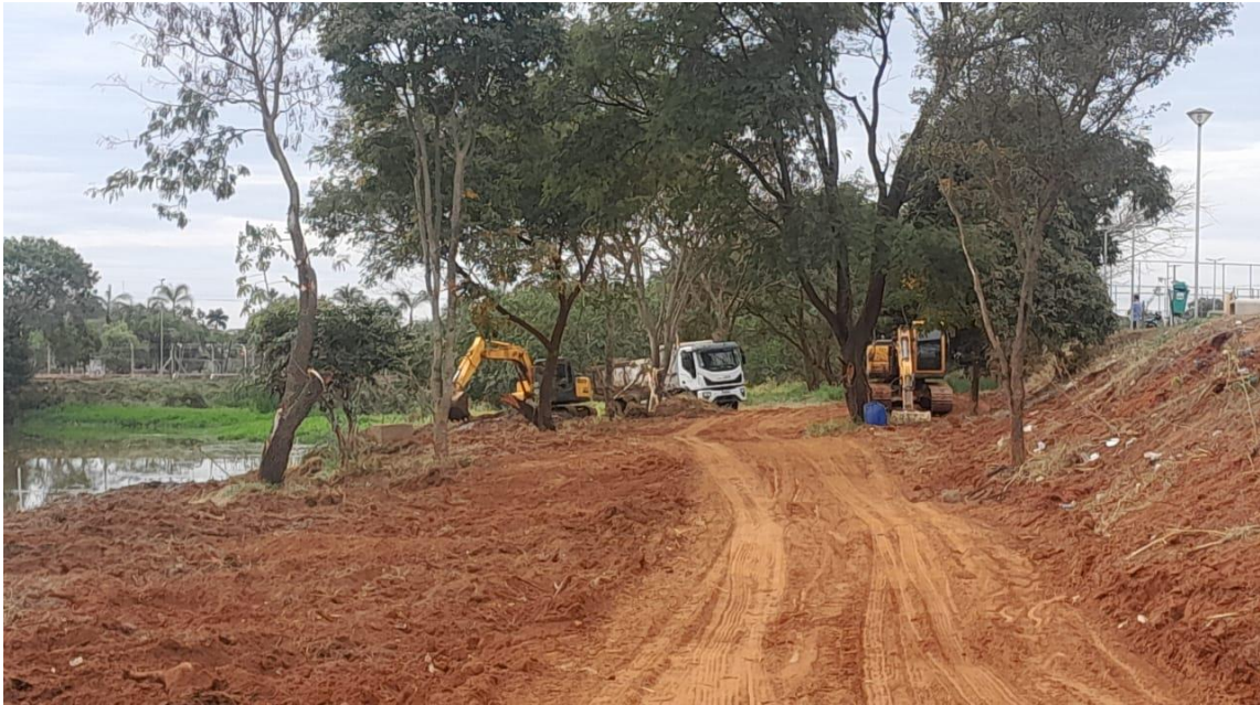
Figura 16 – Retirada de barro da represa