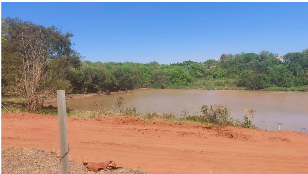
Figura 28 – retirada do barro da represa