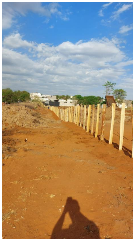
Figura 30 – Construção da paliçada e descarte do material da represa