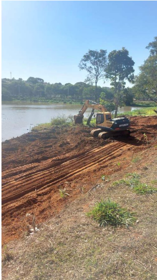
Figura 11 – Continuação segunda etapa dos caminhos de acesso a represa