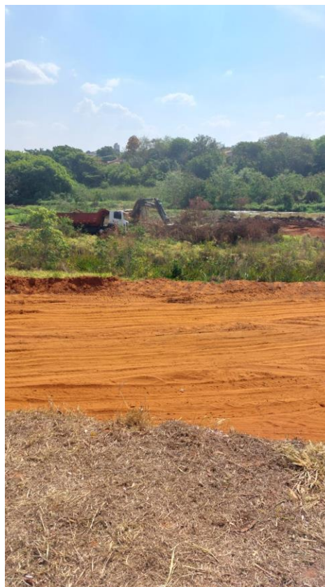
Figura 24 – retirada do barro da represa