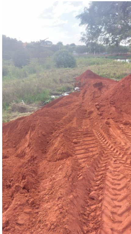
Figura 3 – Construção de rampa de acesso a represa