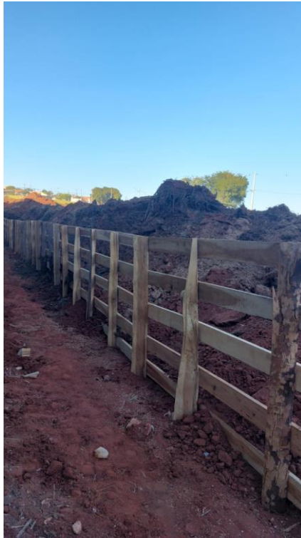
Figura 20 – Construção da paliçada e descarte de material