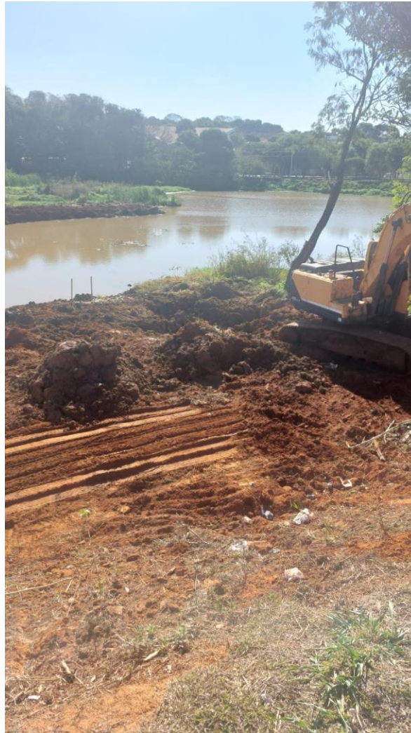
Figura 8 - Primeira etapa finalizada de retirada de barro da represa