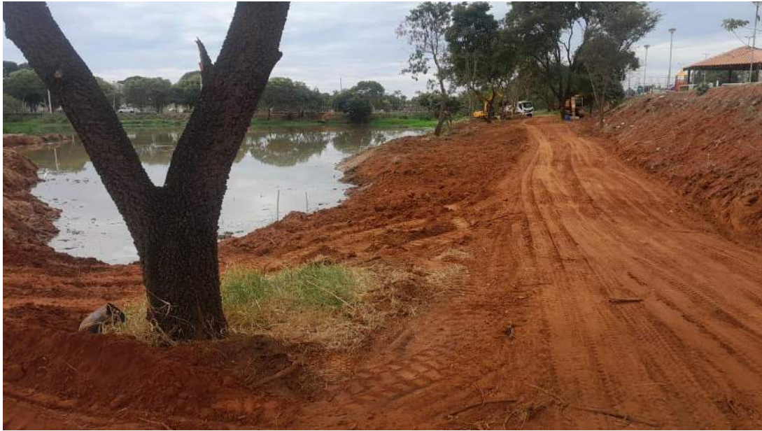
Figura 14 – Continuação segunda etapa dos caminhos de acesso a represa