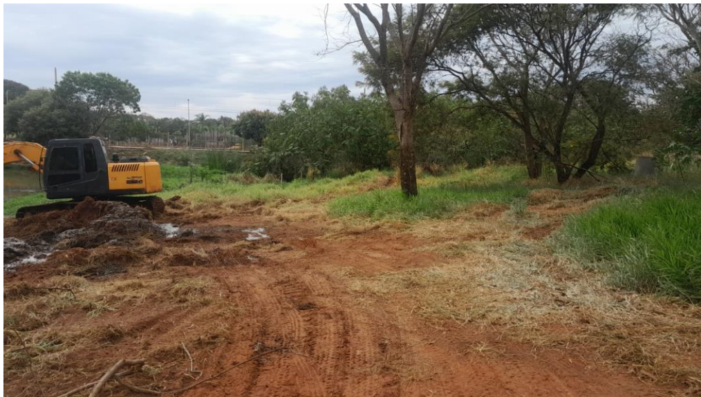
Figura 15 – Retirada de barro da represa