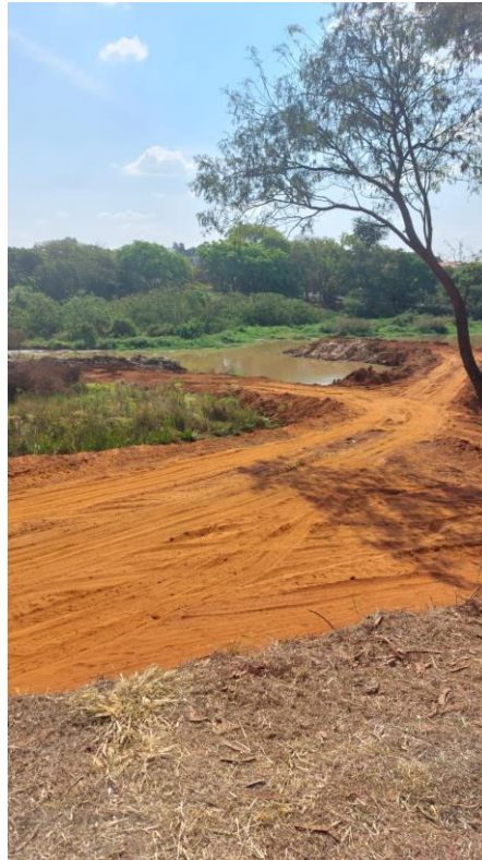
Figura 23 – retirada do barro e fazendo caminhos na represa para acesso