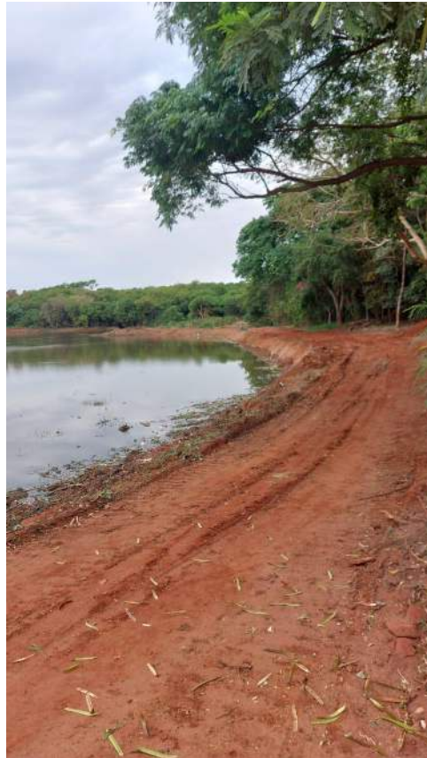
Figura 35 – Retirada de barro da represa