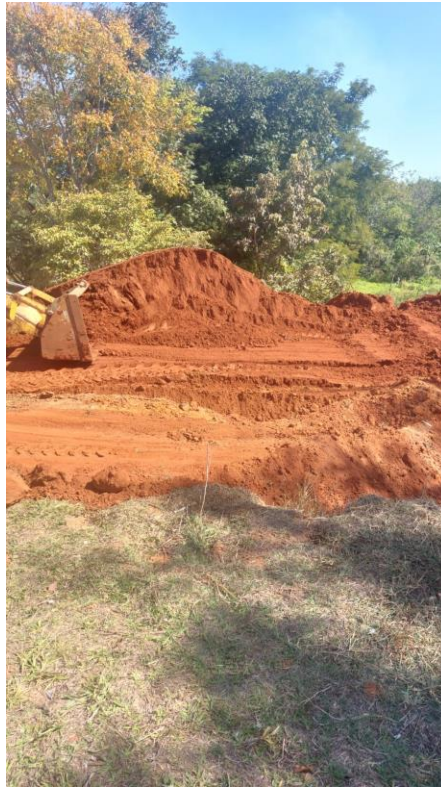
Figura 2 – Construção de rampa de acesso a represa