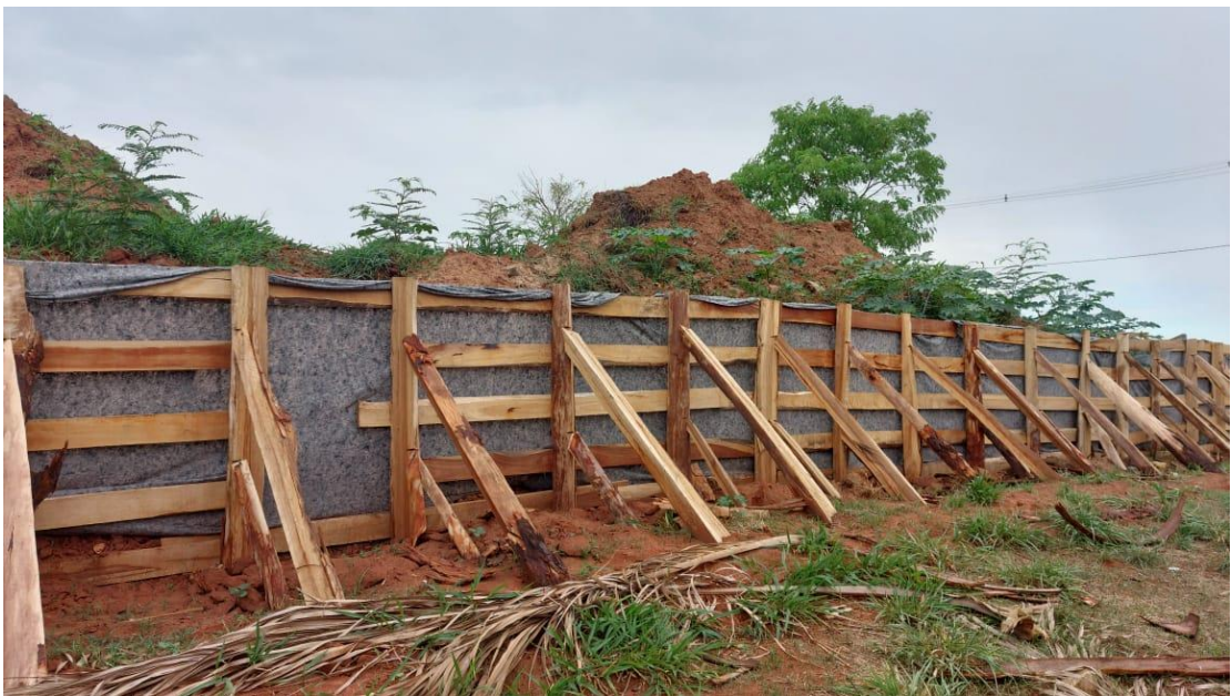
Figura 38 – Descarte da material da represa e finalização da paliçada