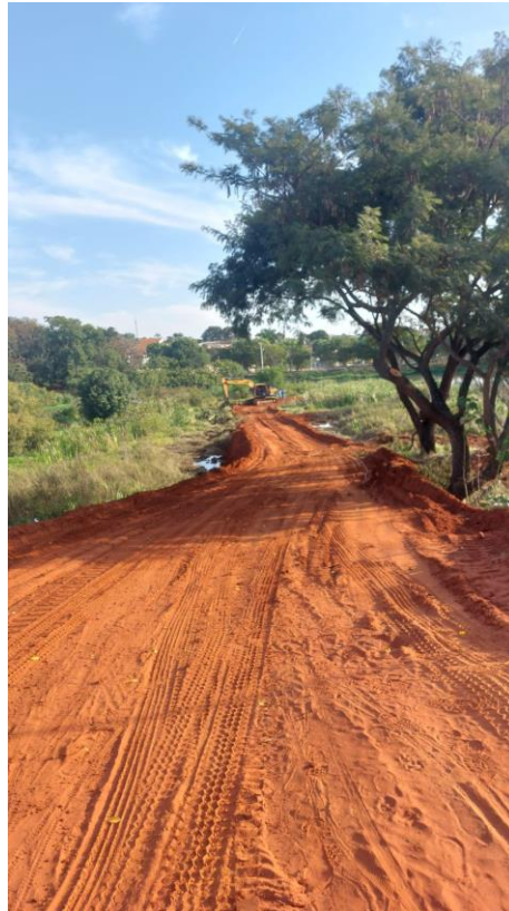
Figura 4 – Início da primeira etapa dos caminhos de acesso a represa