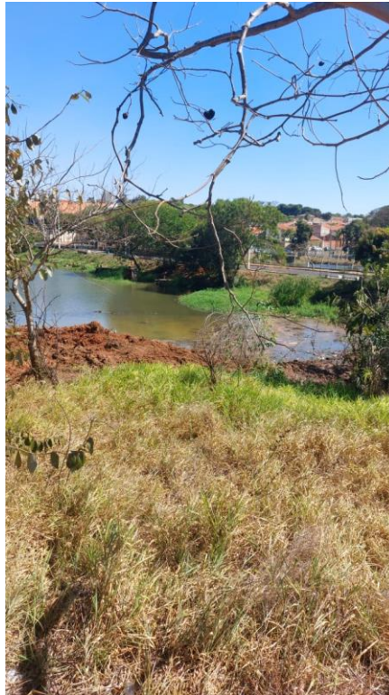
Figura 18 – Retirada de barro da represa