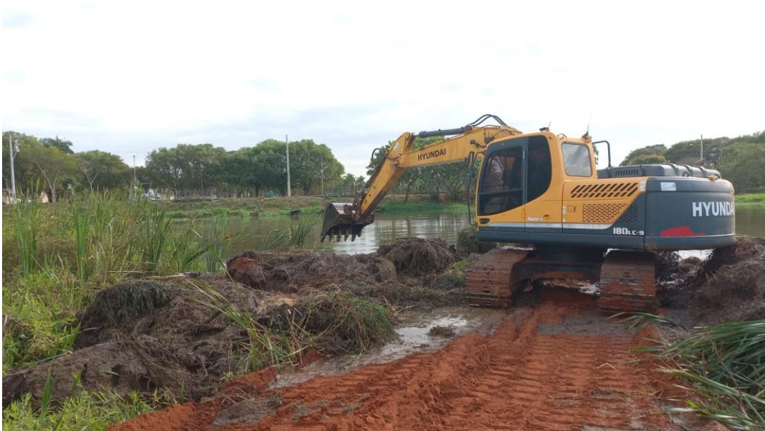
Figura 6 – início da primeira etapa de retirada de barro da represa