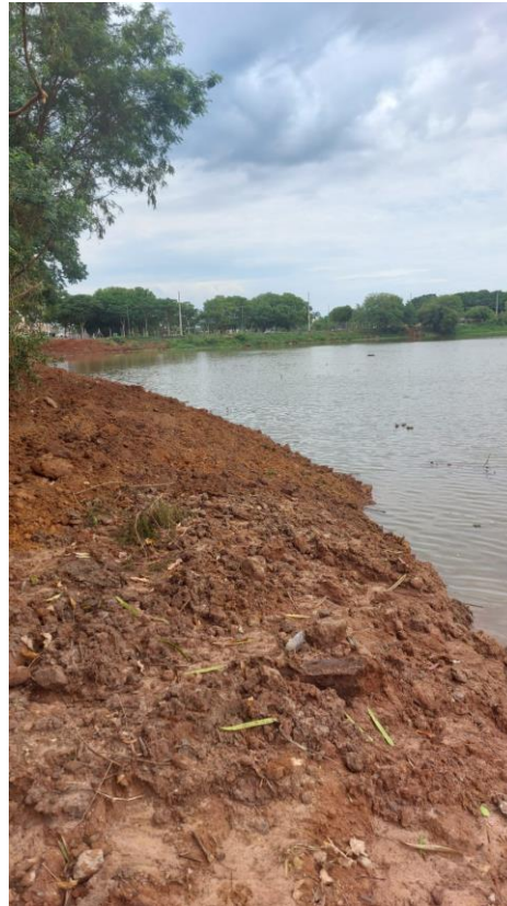
Figura 41 – Término da retirada de barro da represa.