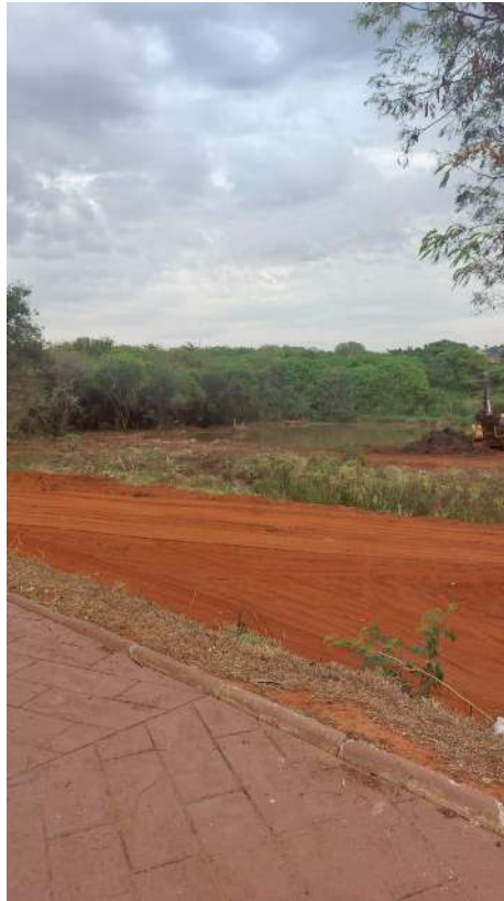
Figura 25 - retirada do barro da represa