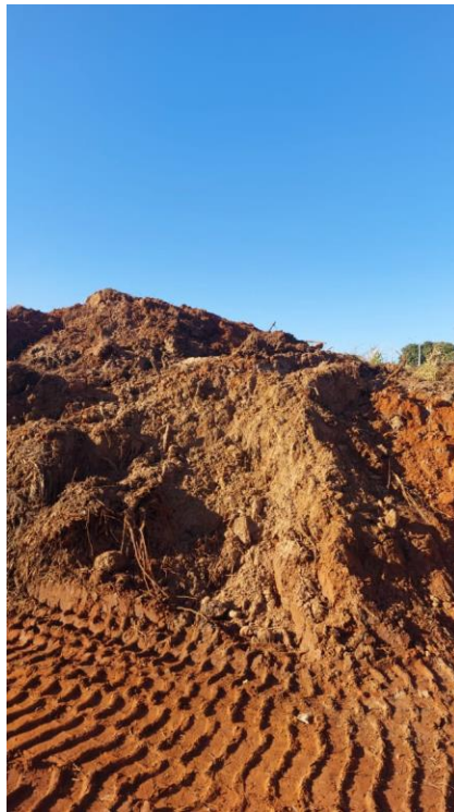
Figura 21 – Descarte de material da represa