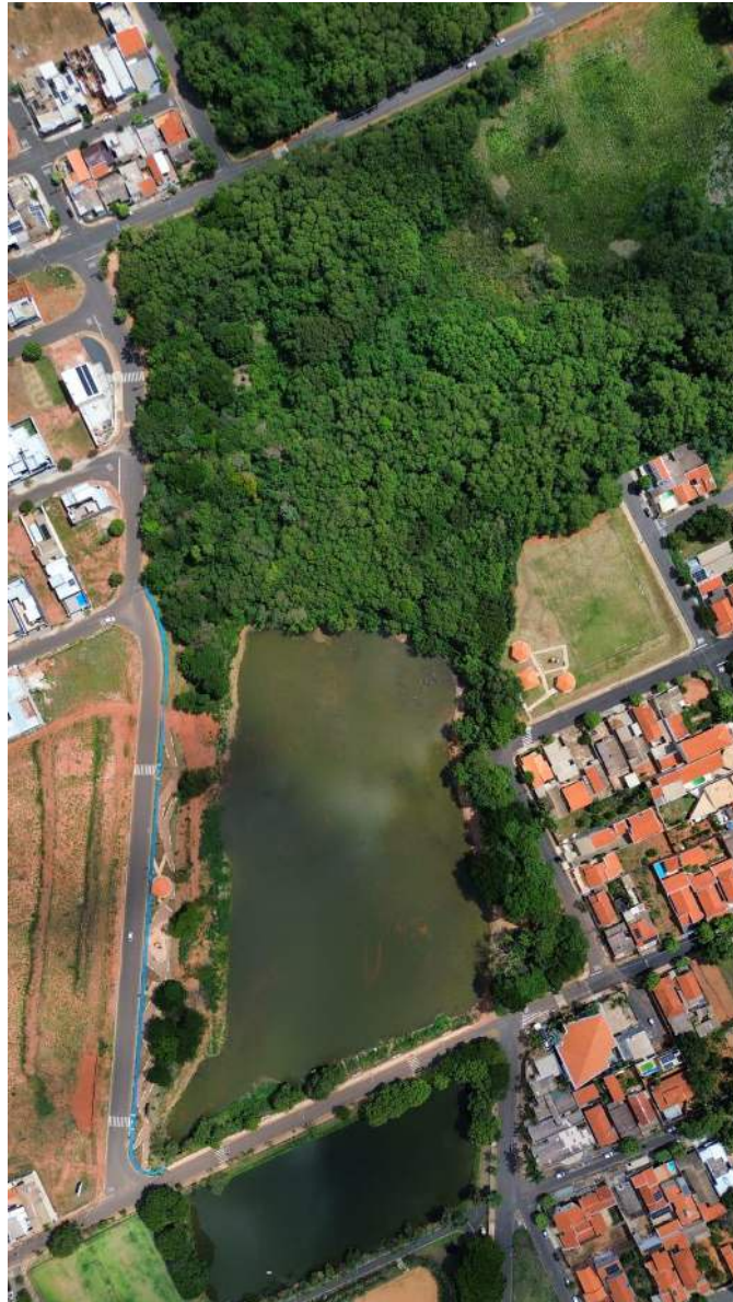
Figura 43 – Término da retirada de barro da represa.