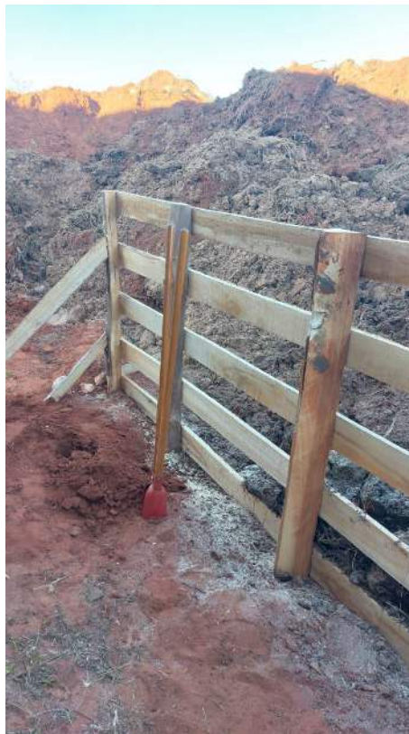
Figura 19 – Construção da paliçada e descarte de material