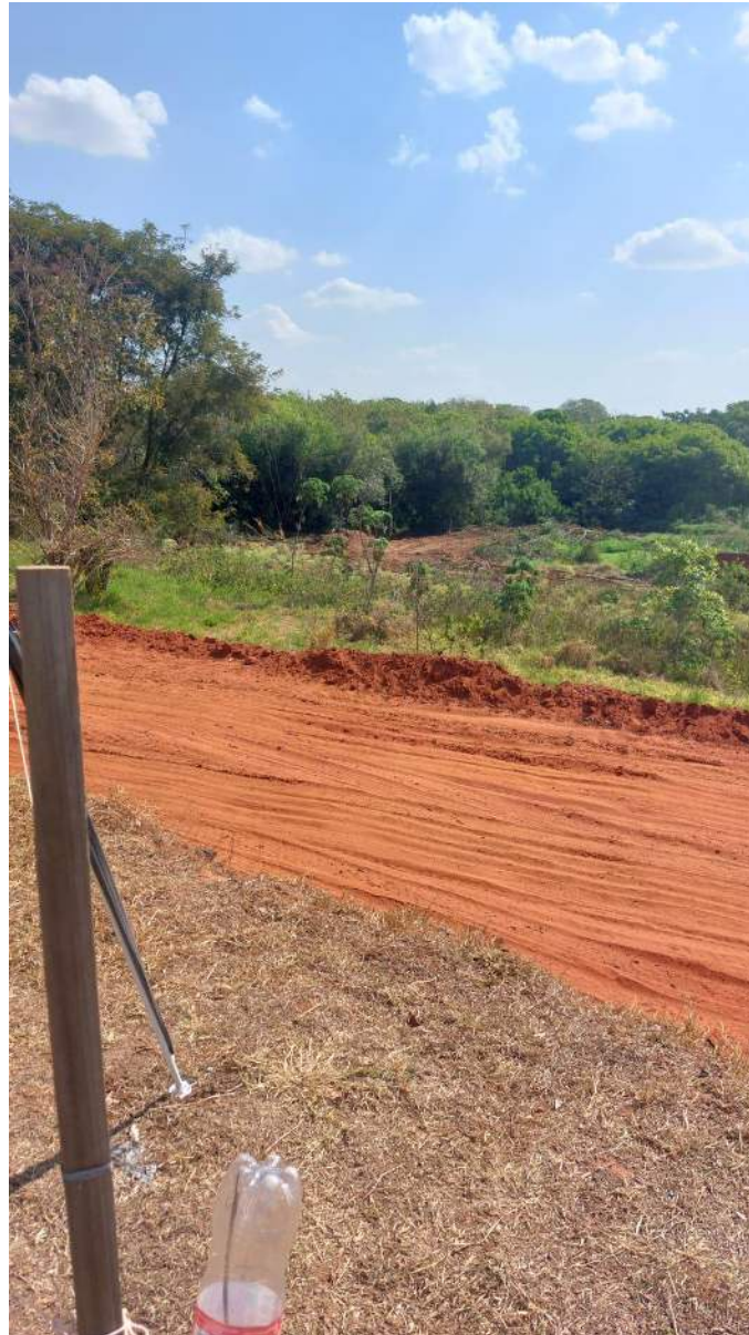
Figura 22 – Fazendo caminhos na represa para retirada do barro