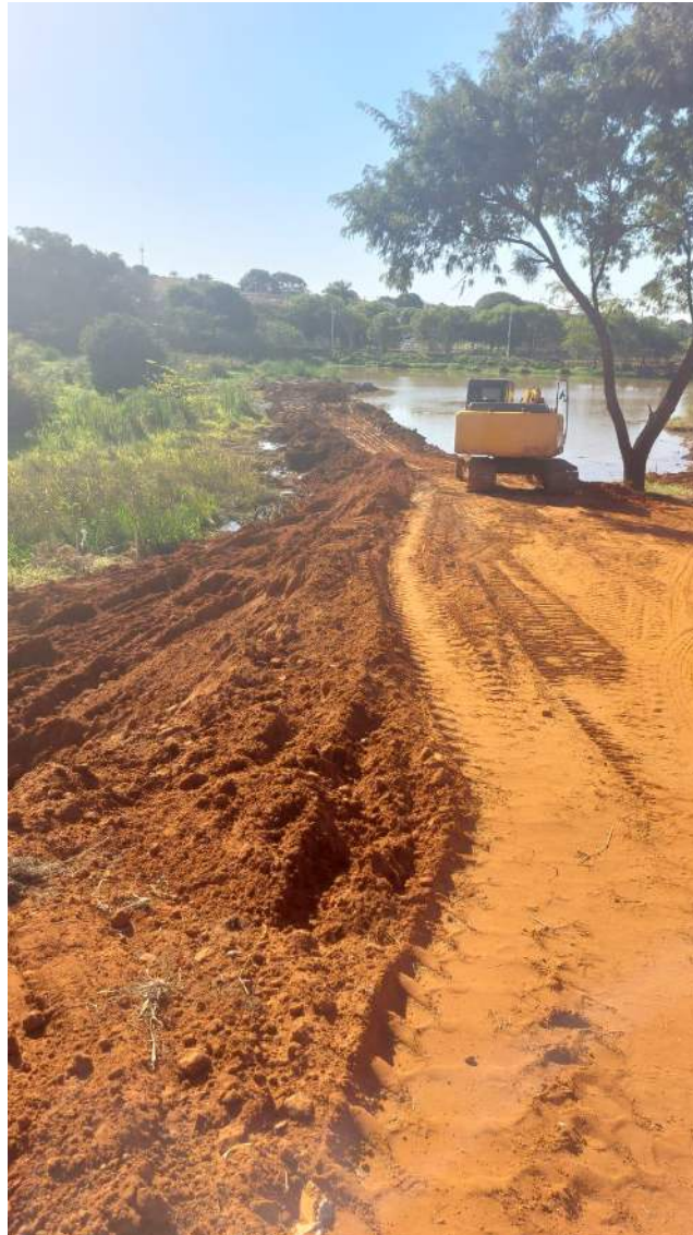
Figura 9 - Primeira etapa finalizada de retirada de barro da represa