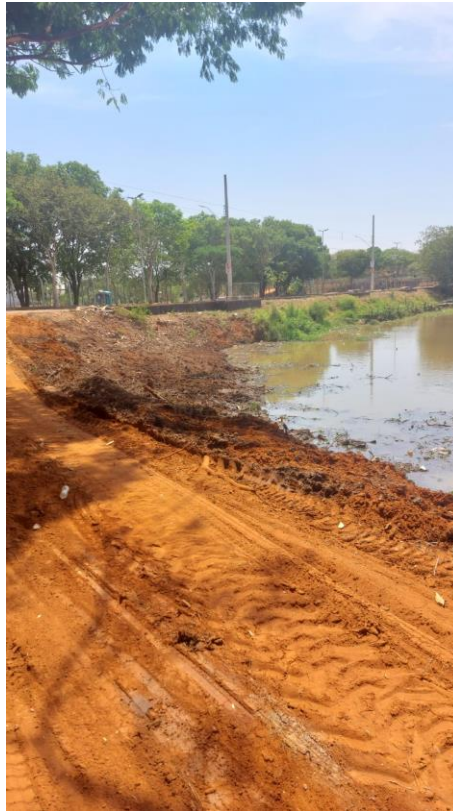
Figura 31 – Construção de caminhos para acesso a represa