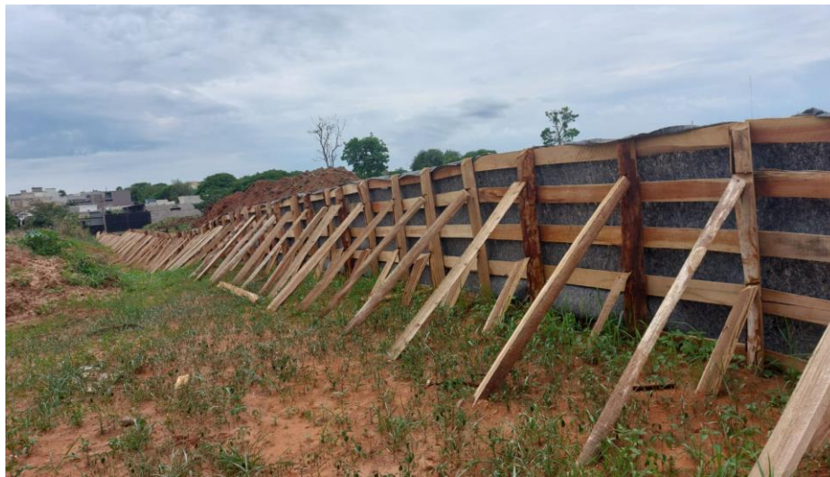
Figura 39 – Descarte da material da represa e finalização da paliçada