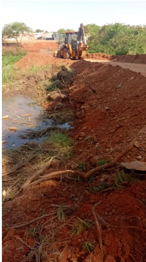
Figura 33 – Construção de caminhos para acesso a represa