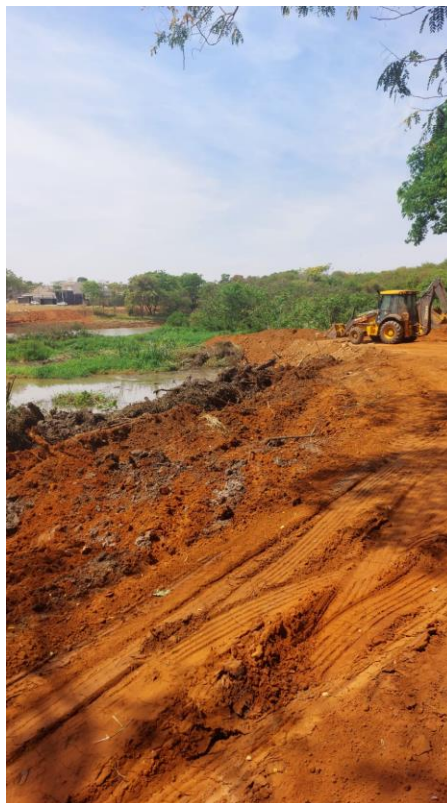
Figura 32 – Construção de caminhos para acesso a represa