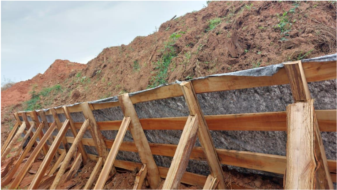
Figura 37 – Descarte da material da represa e finalização da paliçada