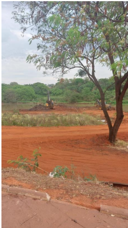
Figura 26 - retirada do barro da represa