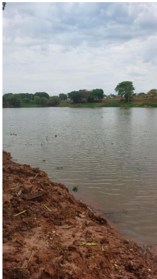
Figura 40 – Término da retirada de barro da represa.