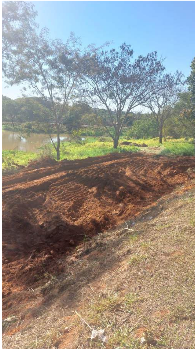
Figura 13 – Continuação segunda etapa dos caminhos de acesso a represa