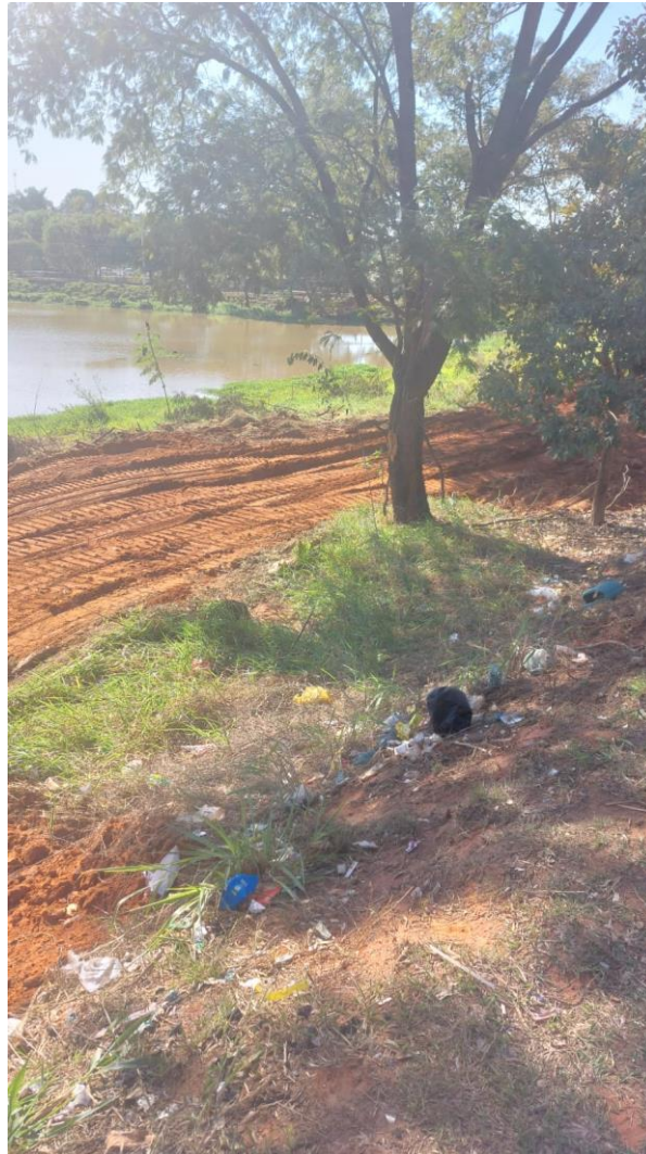
Figura 12 – Continuação segunda etapa dos caminhos de acesso a represa