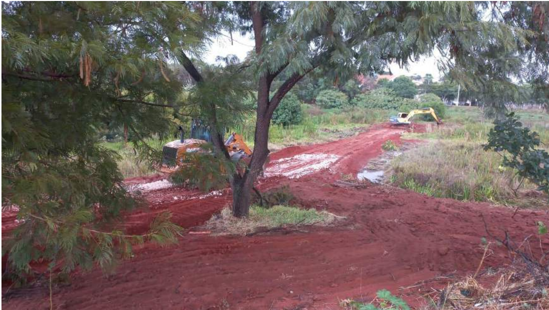
Figura 5 – Início da primeira etapa dos caminhos de acesso a represa