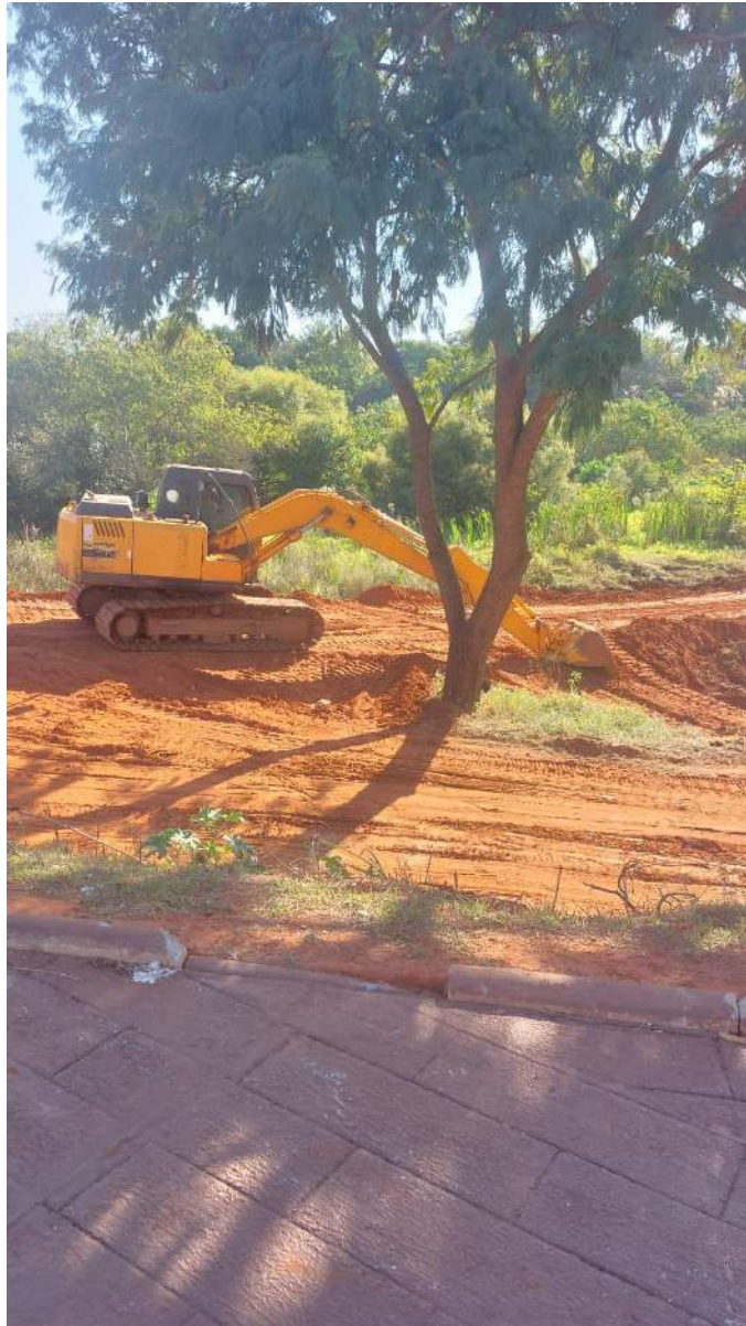
Figura 10 - Início da segunda etapa dos caminhos de acesso a represa