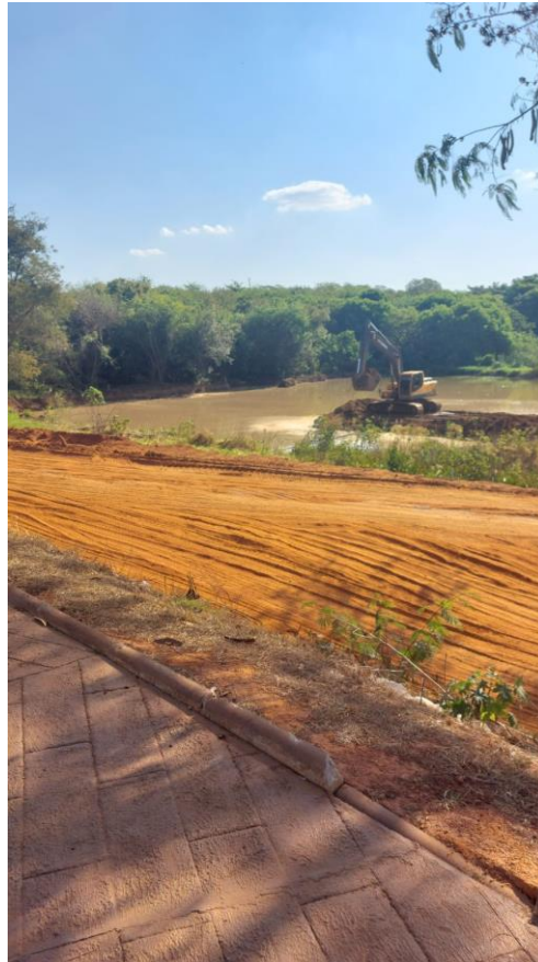
Figura 27 – retirada do barro da represa