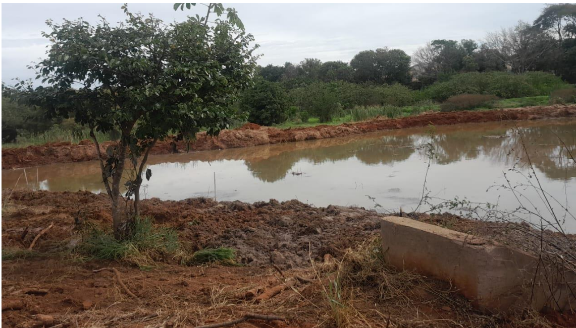
Figura 17 – Retirada de barro da represa