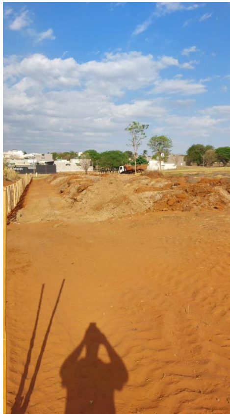
Figura 29 – Construção da paliçada e descarte do material da represa