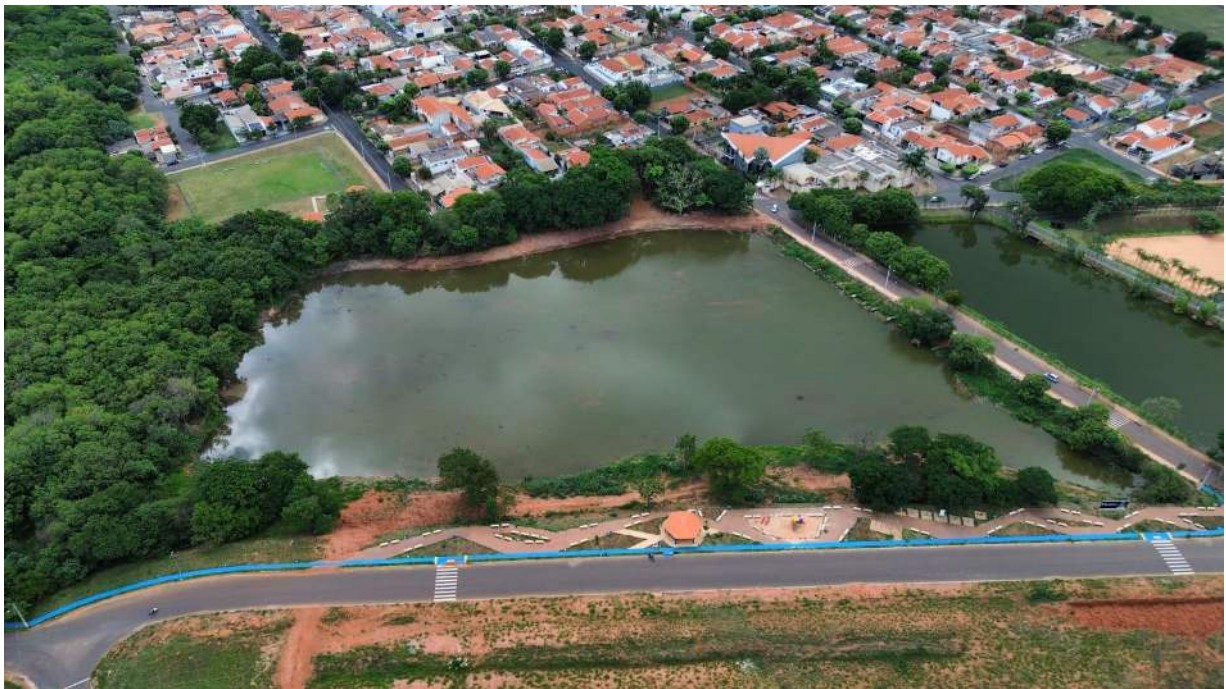
Figura 42 – Término da retirada de barro da represa.