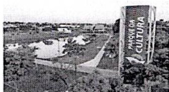
A sede da Secretaria da Cultura e Turismo fica no Parque da Cultura.